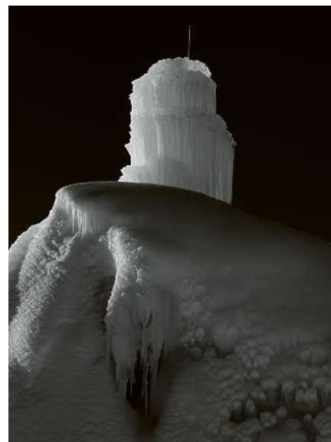
Eisstupa an der Talstation Diavolezza.