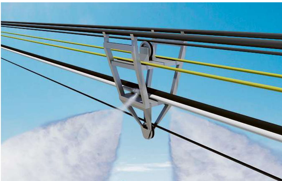
Mit Schneiseilen können täglich grosse Mengen an Schnee produziert werden.