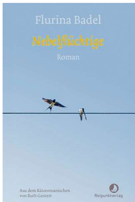
Cover des Buchs «Nebelflüchtige» von Flurina Badel, erschienen im Rotpunktverlag.

dem die Kinder und Jugendlichen eher die Statisten für die viel zahlreicheren Gäste sind als Wahrer einer lebendigen Tradition.