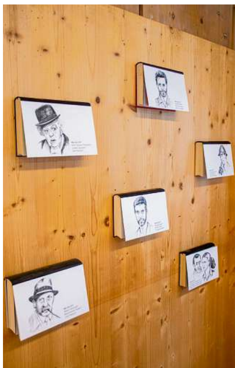
Wer bin ich? Der grosse Detektiv-Rätselspass für die Besucherinnen und Besucher.

ler Amateur C. Auguste Dupin stellt seine analytischen Fähigkeiten erstmals 1841 in Paris unter Beweis, als er den rätselhaften Mord an der Rue Morgue einem Orang-Utan zuordnen kann. Über Conan Doyles populäres Duo Watson und Sherlock Holmes gelangt der Detektivroman 1920 auch nach Graubünden – wie eingangs erwähnt durch einen Niederländer. Bis 1945 gehören hauptsächlich die mondänen Kurorte St. Moritz, Arosa und Davos zu den beliebtesten Krimischauplätzen in Graubünden. 1950 folgt die Zeit der literarischen Solitäre. Das heisst, die literarische Stimme gewisser Autoren und Autorinnen ist derart individuell, dass sie eine eigene Kategorie bildet. Friedrich Dürrenmatt etwa hat mit «Das Versprechen» einen Antikrimi vorgelegt. Die Thematik basiert auf dem Film «Es geschah am helllichten Tag», bei dem die Ermittlung eines Kindermörders im Zentrum steht. Im Film wird der Fall gelöst. Im Buch bleibt er ungelöst. In den 1980er-Jahren kommen die ersten Serienhelden und -heldinnen auf den Markt. Und in den 1990er-Jahren werden verschiedene Krimirezepte ausprobiert. In den 2000er-Jahren wird die Region definitiv zentral. Und in den 2010er-Jahren kommen die grossen Krimiverlage nach Graubünden.