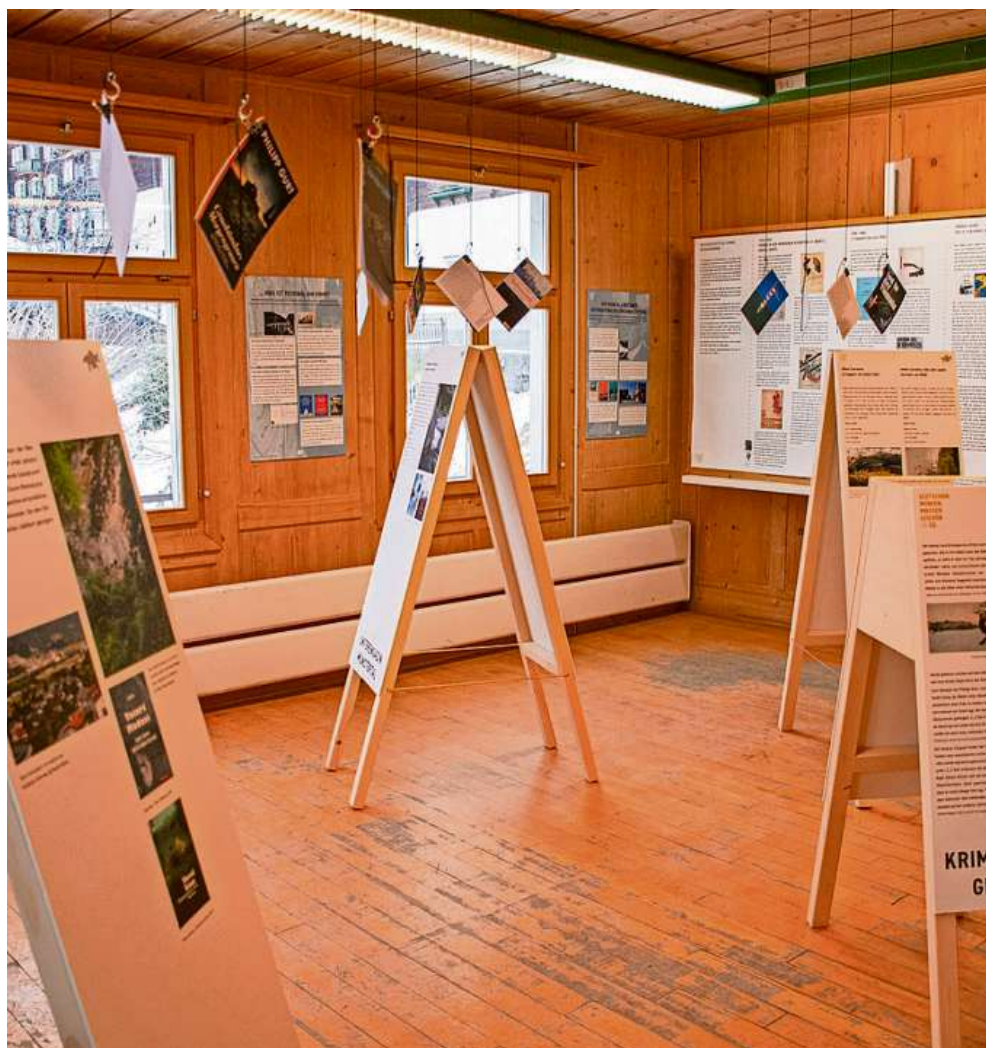
Zahlreiches über Bündner Krimis, Autorinnen und Autoren: Die Ausstellung lädt zum Verweilen ein.