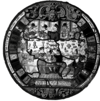
Zunftscheibe im Stadtarchiv: Zunftmahl in Chur, evtl. Schmiedezunft, 16. Jh. Churer Stadtgeschichte, Bd. 1, S. 304.

Die politischen Aufgaben der Zünfte bestanden in der Wahl der städtischen Behörden, im Fassen von Beschlüssen zu städtischen und Bundesangelegenheiten. Die Mehrheit der Zünfter bestimmte die Stellungnahmen der gesamten Korporation, deren Stimme schliesslich zählte. Wenn drei Zünfte einer Vorlage zustimmten, war diese angenommen. Beisassen, d.h. auswärtige Niedergelassene ohne Bürgerrecht, hatten kein Stimmrecht, höchstens allenfalls beschränkte Nutzungsrechte. Das sind nur einige wenige Angaben. Wer mehr erfahren will, lese nach in der Churer Stadtgeschichte Bd. 1, S. 303-323; Bd. 2, S. 121-172, Chur 1993.