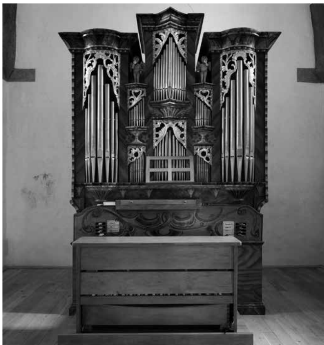
Die denkmalgeschützte Ammann-Orgel von 1820.