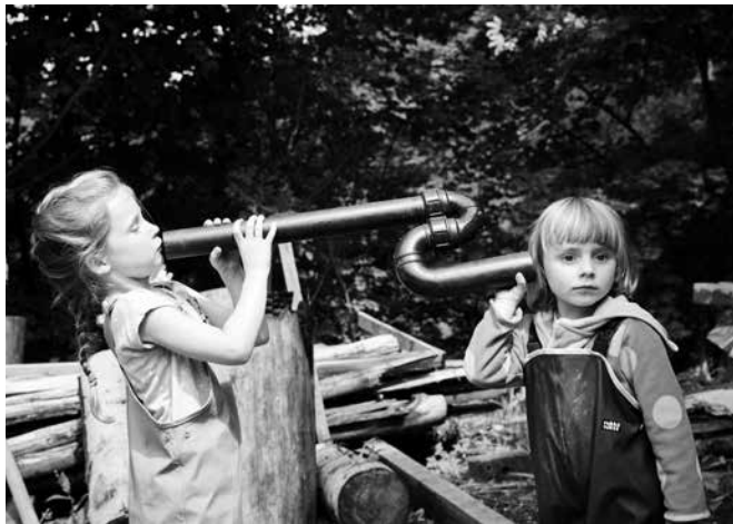
Spielen_ unterwegs sein _ Hörrohr.