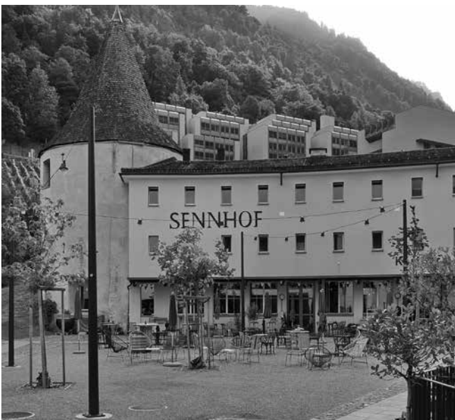
Gartenrestaurant im Sennhof.