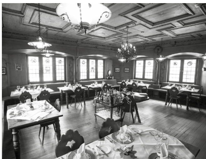
Die letzte noch erhaltene Zunftstube im «Rebleuten».

Masse und Gewichte: Handbuch der Bündner Geschichte, Bd. 4, S. 322f., Chur 2000; Historisches Lexikon der Schweiz HLS (Internet).