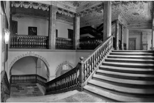
Treppenaufgang im Bischöflichen Schloss.