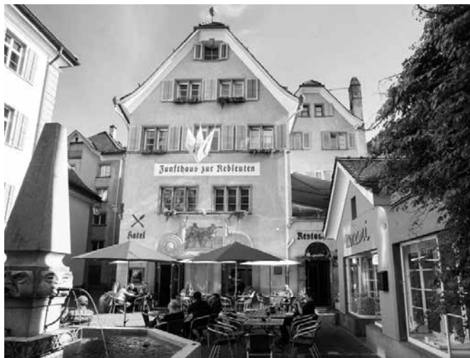
Ein ehemaliges Zunftthaus: das Rebleuten.