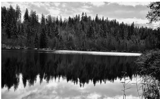
Krimi-Schauplatz Crestasee.

Der Bündner Krimi und seine Vorbilder. Vortrag von Dr. Thomas Barfuss im Rahmen der Ausstellung «Gletschermumien, Wasserleichen & Co.». Altes Schulhaus Tschierschen