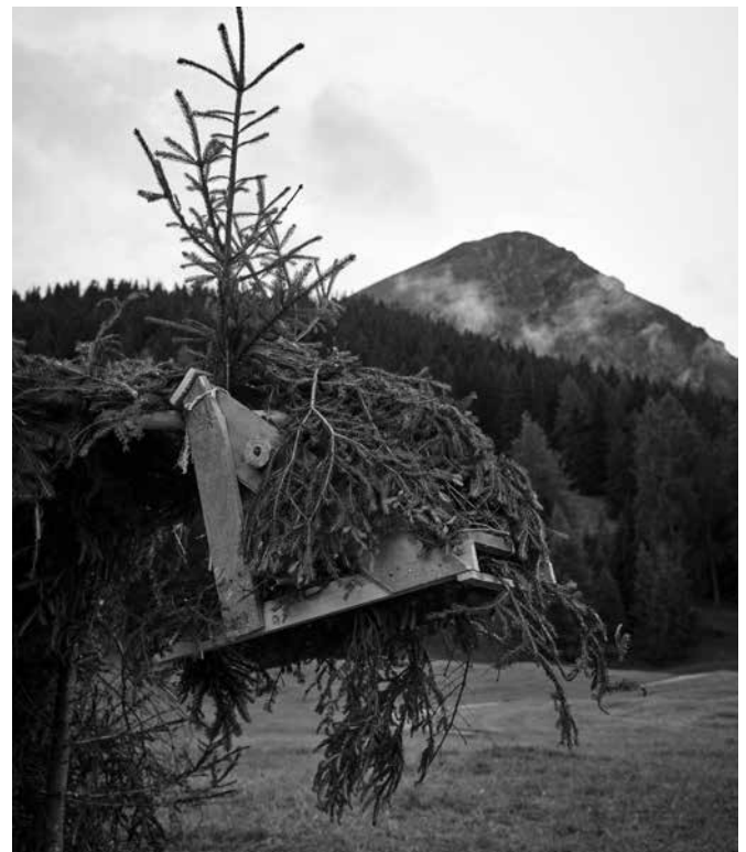
Holz bearbeiten: Drachenkopf.

Das kann unter dem Hochbett in der Ferienwohnung sein, in der Spielecke im Hotel Alpina, oder im eigenen Zimmer in Chur. Wichtig ist es, dass ein sicherer, vertrauter und gemütlicher Ort zur Verarbeitung des Erlebten und zur Regeneration vorhanden ist. Lieblingsorte, die immer wieder aufgesucht werden, helfen, sich in den Ferien wohlfühlen. Das kann der Spaziergang zum Dorfladen sein, ein Aufenthalt im Erlebnisstall oder das Barfusslaufen im Fuxliweiher.