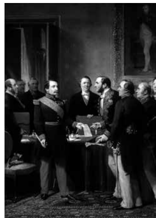
Pompöse Zeremonie der Eingemeindung von zahlreichen Vororten von Paris durch Napoleon III. per Dekret (1850er-1870er Jahre). So stillvoll wurden Tschierschen und Praden nicht in Chur integriert, dafür aber demokratisch. Gemälde von Georges Yvon 1860.

Chur ist also grösser, höher, anders geworden. Noch ist die Behördenstruktur aber gleich wie 1964. Im Moment wird in «Politisch-Chur» wieder einmal diskutiert, den Stadtrat mit seiner schweizweit einzigartigen Grösse (resp. Kleine) von drei Personen auf fünf Sitze zu erweitern. Damit könnte unter anderem die neue Vielfalt der gewachsenen Stadt besser abgebildet werden - nicht nur, was das politische Spektrum angeht. Die Grösse des Gemeindeparlamentes scheint kaum zur Diskussion zu stehen. Im Gemeinderat ist Haldenstein mit gegenwärtig zwei Personen recht gut vertreten. Ich bin gespannt, wann erstmals ein Sitz im historischen Ratssaal von einem Ratsmitglied aus den «ländlichen» Fraktionen Maladers, Tschierschen oder Praden besetzt werden kann. Das würde mich freuen.