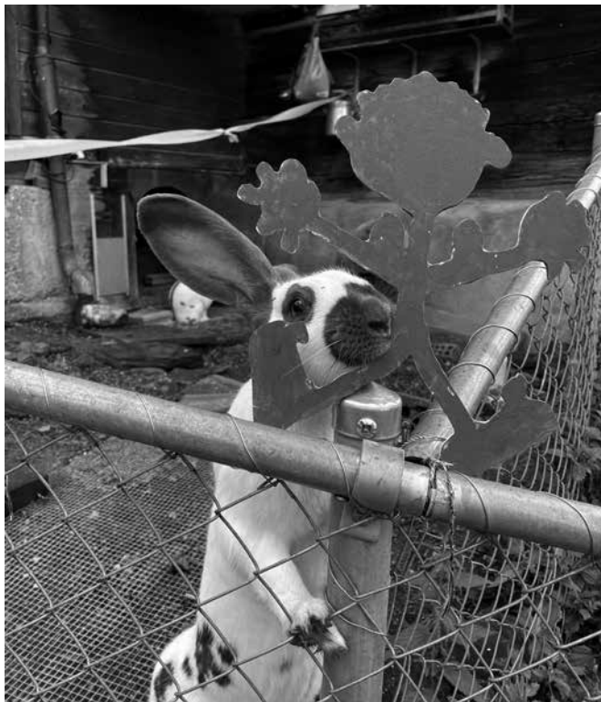
Kaninchen mit TSCHIERP.