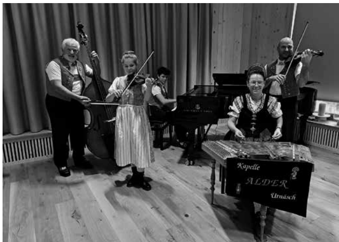
Kapelle Alder Urnäsch.