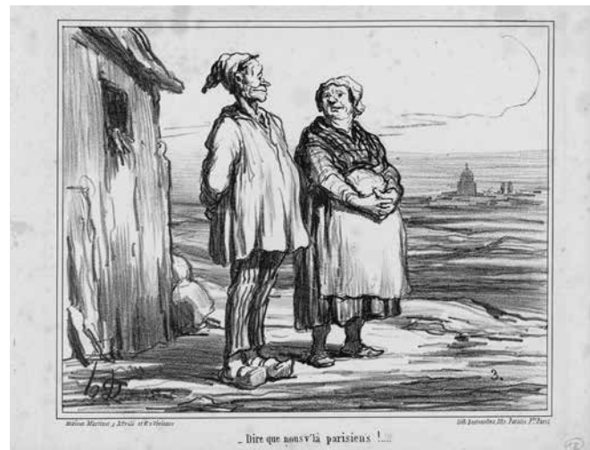
«Dire que nous v'là parisiens!» Honoré Daumiers Karikatur 1860 zur grossen Eingemeindung von Paris.