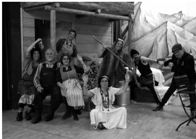
Theaterverein Tschierschen-Praden.

Erwachsene CHF 20.–, Kinder von 13-16 Jahre CHF 10.–, Kinder von 6-12 Jahre CHF 6.–