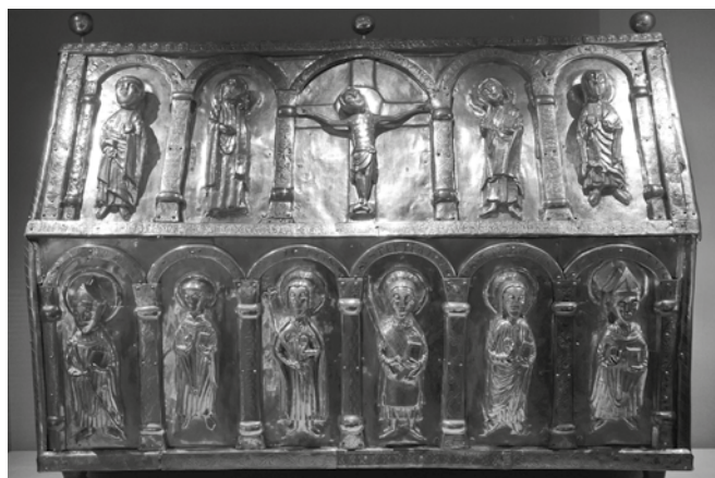
Schrein im Domschatzmuseum.