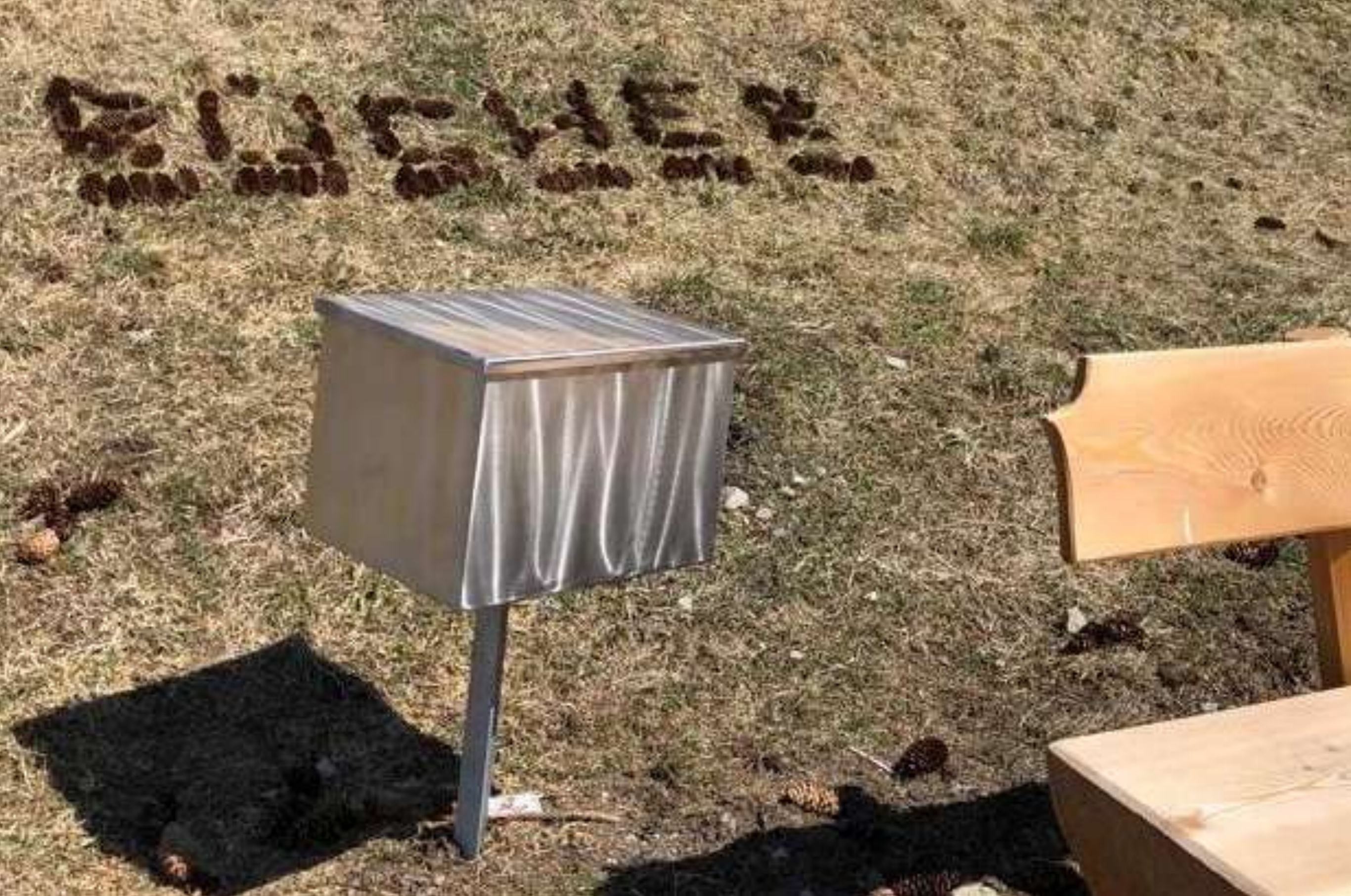
Neue Lesebänke und Bücherboxen