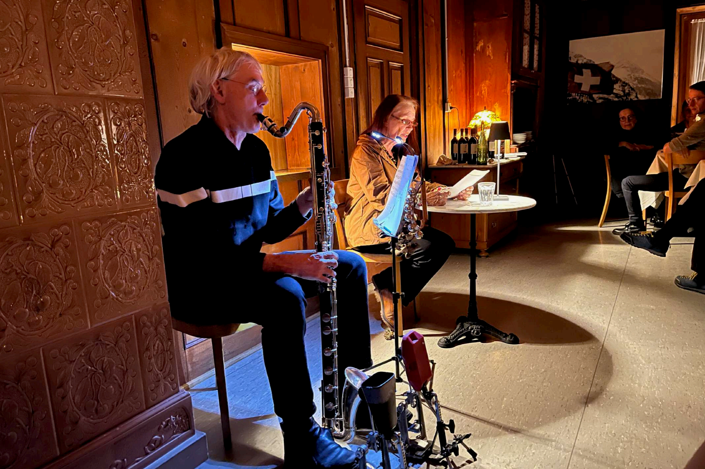
23. Januar 2023: Ässa wie äsia