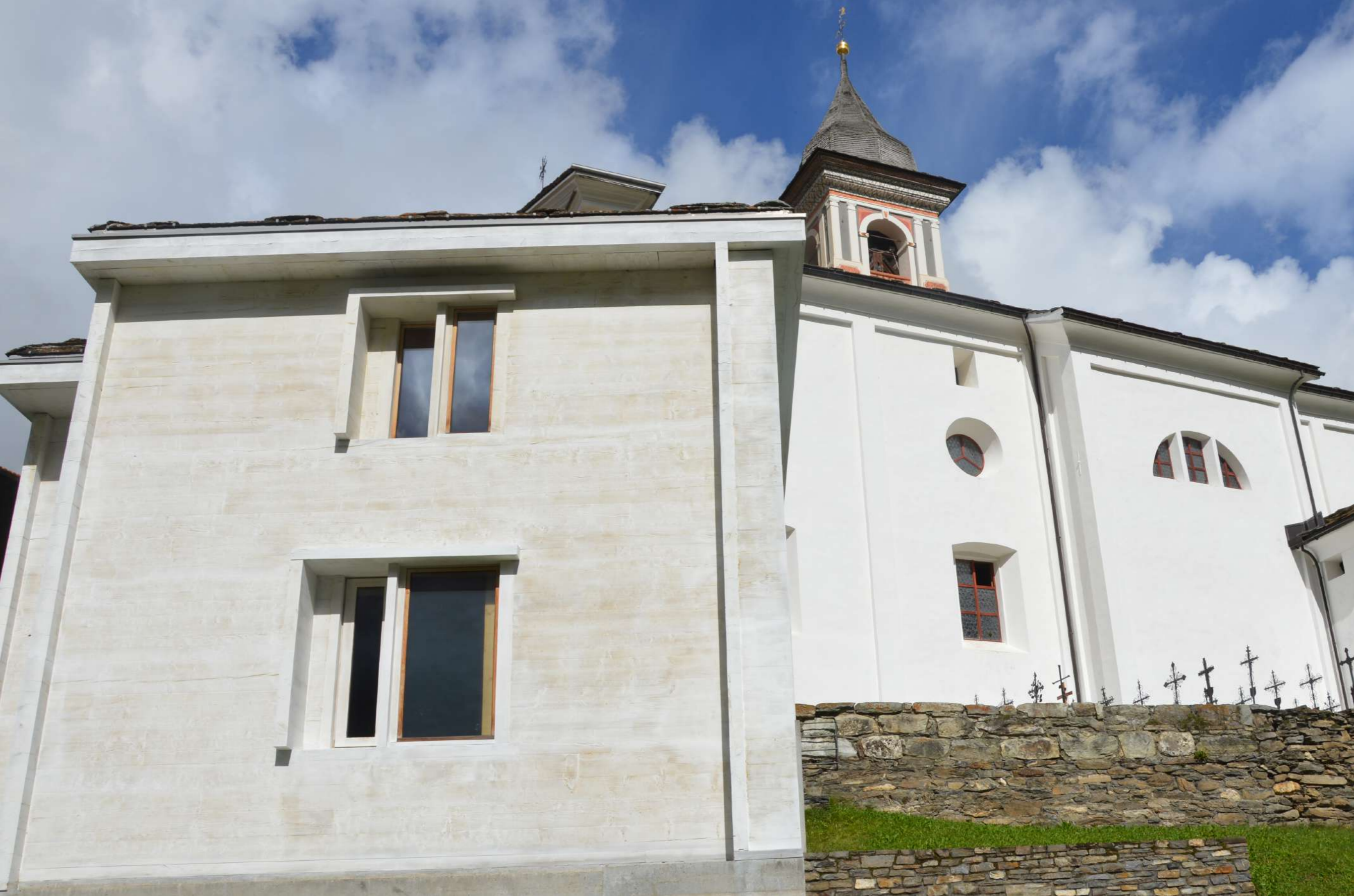
10.9. 2022: Vereinsreise ins Lugnez: Stiva da morts