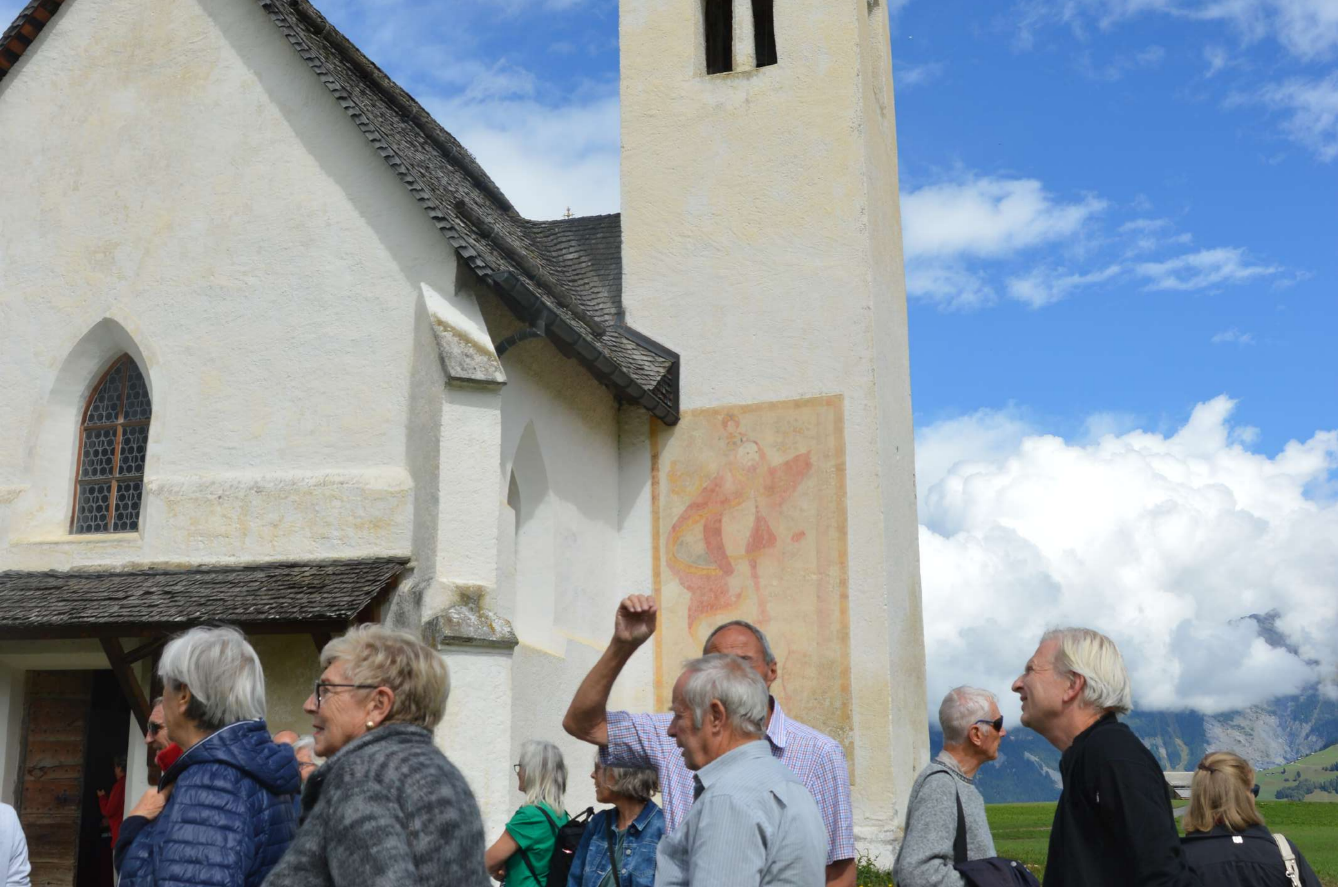
10.9. 2022: Vereinsreise ins Lugnez: Sogn Bistgaun