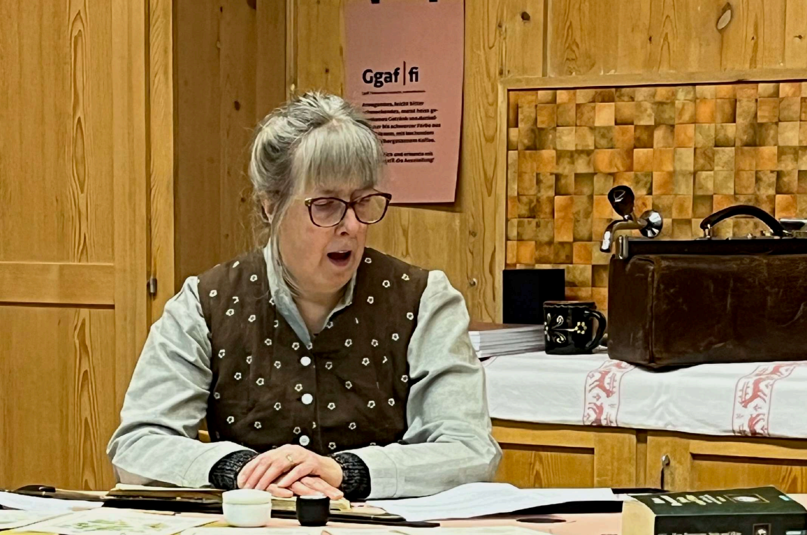
15. Februar 2023: GRET, Rahmenveranstaltung Uf än Ggaffi