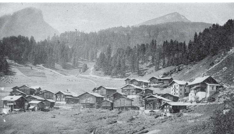
Damals – und noch lange Zeit später – wäre eine Fusion undenkbar gewesen: Tschierschen 1908/1909, Praden 1910.

Der Alltag geht weiter. Die vor der Fusion vielgepriesenen Einsparungen hielten sich wohl in Grenzen. Bei der Verwaltung, durch vereinfachte Organisationsstrukturen, gab es sie sicher.