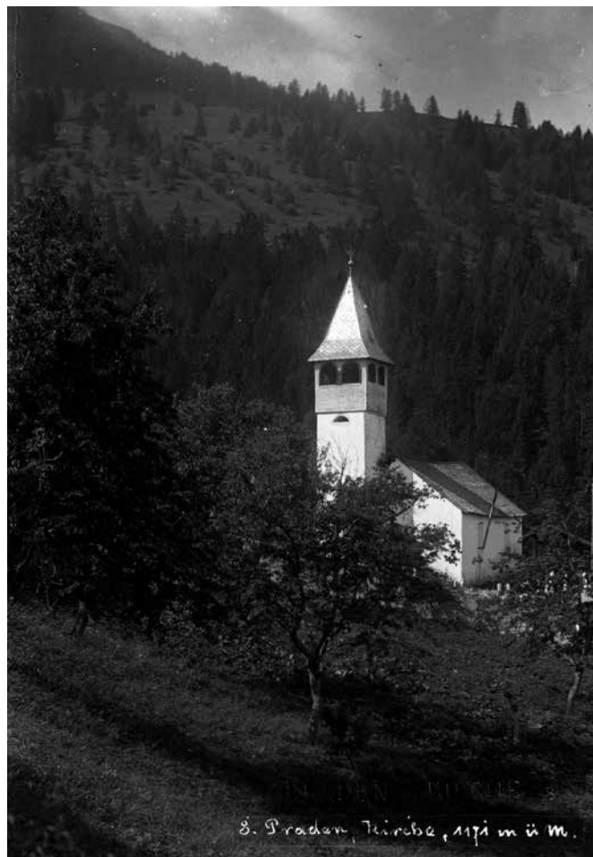
Kirche Praden um 1930.

Unterschiede zwischen den beiden Gemeinden zeigten sich öfter im Abstimmungsverhalten. Praden stimmte oft etwas anders als Tschierstchen und der übrige Kanton, mehr links-grün (zusammen mit wenigen andern Aussenseitern wie dem Val Calanca). Ich erinnere dabei an die ominöse Abstimmung zur Abschaffung der Armee. Praden hat als eine der ganz, ganz wenigen Gemeinden die Initiative der GSoA angenommen, was der Gemeinde kurzfristig zur schweizweiten Bekanntheit