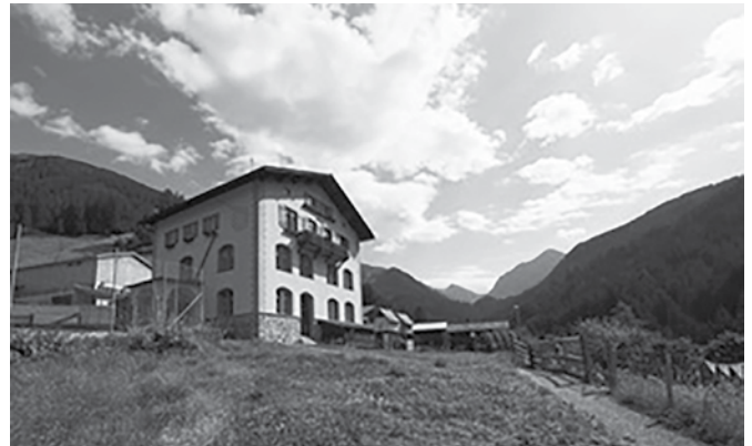
Kulturhaus Schanfigg in Langwies

zu schnell verworfen aufgrund der Kosten. Doch manchmal muss man das Pferd von hinten aufzäumen, wie es doch so schön heisst, und dafür braucht es dann sehr viel Energie, Überzeugungskraft und Zeit. Einige Projekte werden wieder