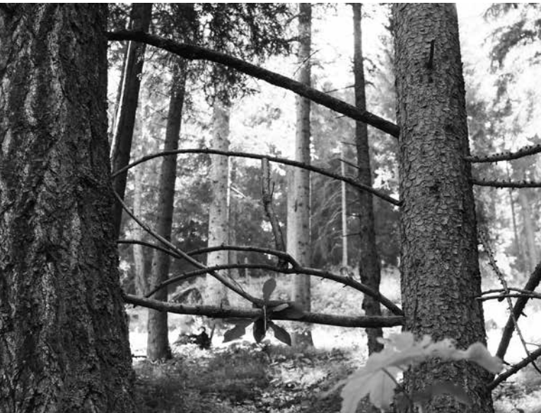
oben: Landart. Bilder: Hanspeter Ulrich rechts: Porträtfotografie aus dem Buch «Praden: Vom Überleben auf dem Dorfe» von Katharina Krauss-Vonow

Hanspeter Ulrich hat uns als Fotograf begleitet. Einige seiner Bilder sind auf pro-tschiertschen-praden.ch zu sehen.